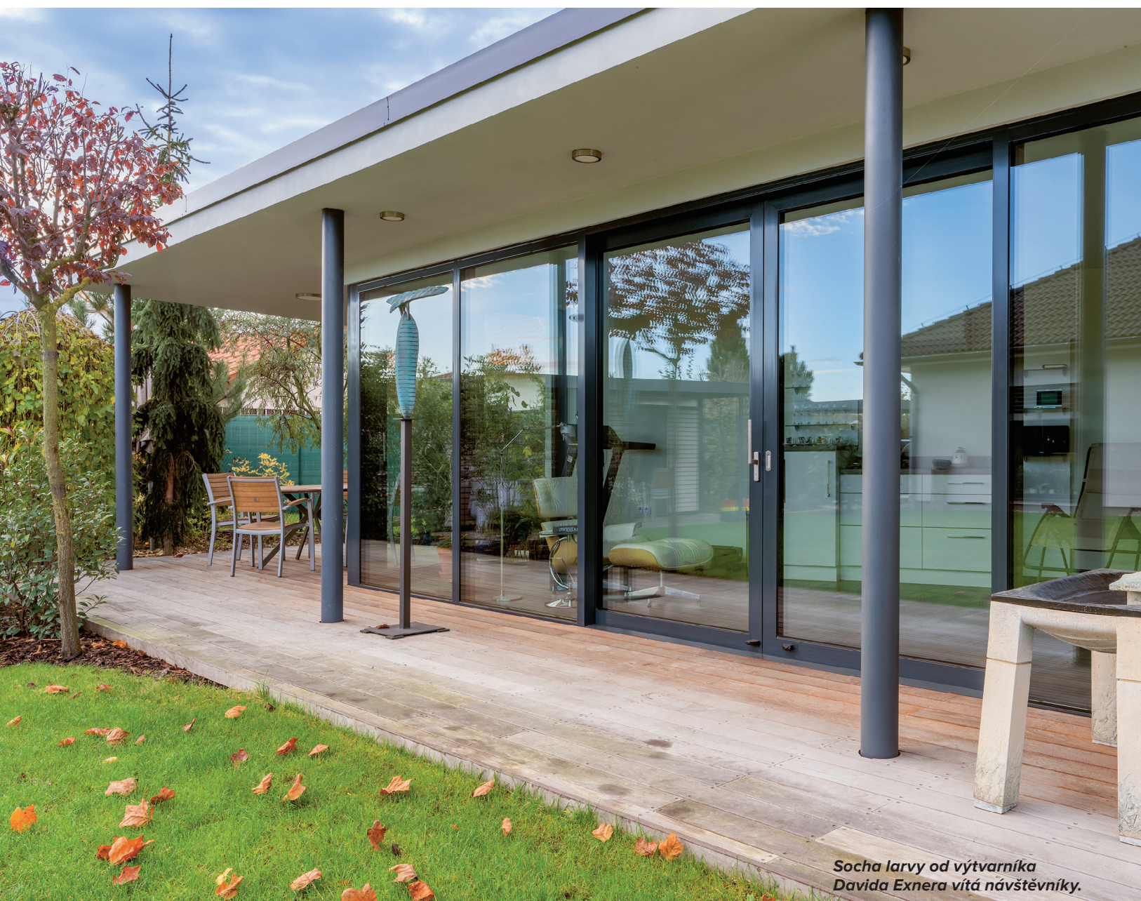
Socha larvy od výtvarníka Davida Exnera vítá návštěvníky.