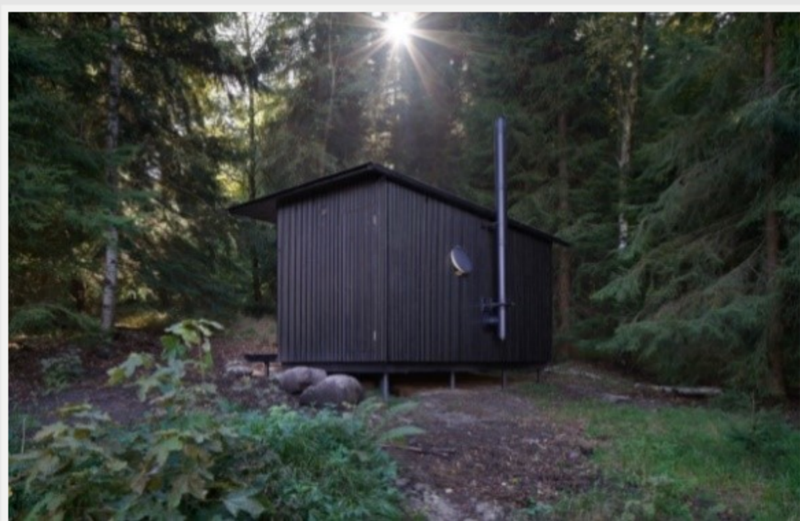
fasáda z modřínového dřeva, vstup do technické místnosti z boku chatky, foto: Jan Kuděj

Jednopodlažní chatka s rozměry 2,5 x 5 metrů je řešená jako montovaná dřevostavba založená na základovém roštu ze smrkových KVH trámů kotveném do rostlého terénu pomocí zemních vrutů. Její koncept je založen na principu stavebnice tak, aby ji bylo možné postavit ve dvou až třech lidech. Jako základní materiál jsou proto použity desky z překližovaného masivního smrkového dřeva. Váha jednotlivých dílců se pohybuje okolo 80 kilogramů. „Prefabrikované panely jsou opracovány a připraveny v nábytkářském standardu tak, aby je za pomoci běžných nástrojů a nářadí dokázal snadno smontovat každý zručnější domácí kutil svépomocí,“ popisuje Ing. arch. Daniel Rohan. Terasa i fasáda jsou z modřínového dřeva ošetřené olejou lazuru. Pro odvětrávání je ve fasádě na severní stěně vytvořený kruhový větrací prostup. Na plochu střechu s minimálním spádem byl položen hliníkový plech s jemnou vlnou v antracitově šedém odstínu, který koresponduje s barevným laděním celé stavby. Chatka je z přední strany pohledově rozdělena velkoformátovým fixním zasklením, které je právě s ohledem na snadnou montáž kvůli vysoké váze skla tvořené ze tří samostatných segmentů.