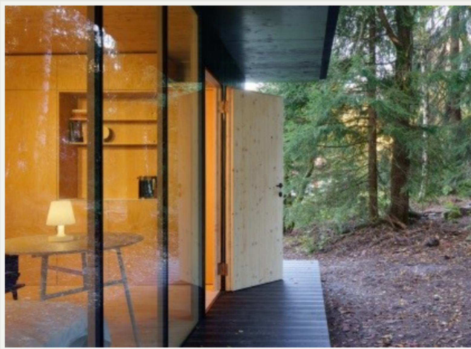
vstupní dveře s klikou DENEY v povrchové úpravě titan černý mat