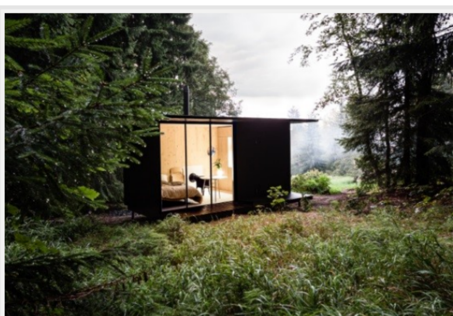
chatka Tiny House Done skýtá výhled do okolní přírody

Jednopodlažní chatka s rozměry 2,5 x 5 metrů je řešená jako montovaná dřevostavba založená na základovém roštu ze smrkových KVH trámů kotveném do rostlého terénu pomocí zemních vrutů. Její koncept je založen na principu stavebnice tak, aby ji bylo možné postavit ve dvou až třech lidech. Jako základní materiál jsou proto použity desky z překližovaného masivního smrkového dřeva. Váha jednotlivých dílců se pohybuje okolo 80 kilogramů. „Prefabrikované panely jsou opracovány a připraveny v nábytkářském standardu tak, aby je za pomoci běžných nástrojů a nářadí dokázal snadno smontovat každý zručnější domácí kutil svépomocí,“ popisuje Ing. arch. Daniel Rohan. Terasa i fasáda jsou z modřínového dřeva ošetřené olejou lazuru. Pro odvětrávání je ve fasádě na severní stěně vytvořený kruhový větrací prostup. Na plochu střechu s minimálním spádem byl položen hliníkový plech s jemnou vlnou v antracitově šedém odstínu, který koresponduje s barevným laděním celé stavby. Chatka je z přední strany pohledově rozdělena velkoformátovým fixním zasklením, které je právě s ohledem na snadnou montáž kvůli vysoké váze skla tvořené ze tří samostatných segmentů.