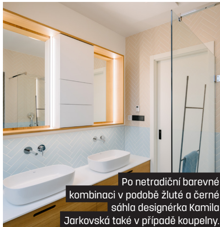
Po netradiční barevné kombinaci v podobě žluté a černé sáhla designérka Kamila Jarkovská také v případě koupelny.