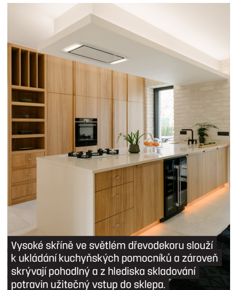
Vysoké skříně ve světlém dřevodekoru slouží k ukládání kuchyňských pomocníků a zároveň skrývají pohodlný a z hlediska skladování potravin užitečný vstup do sklepa.