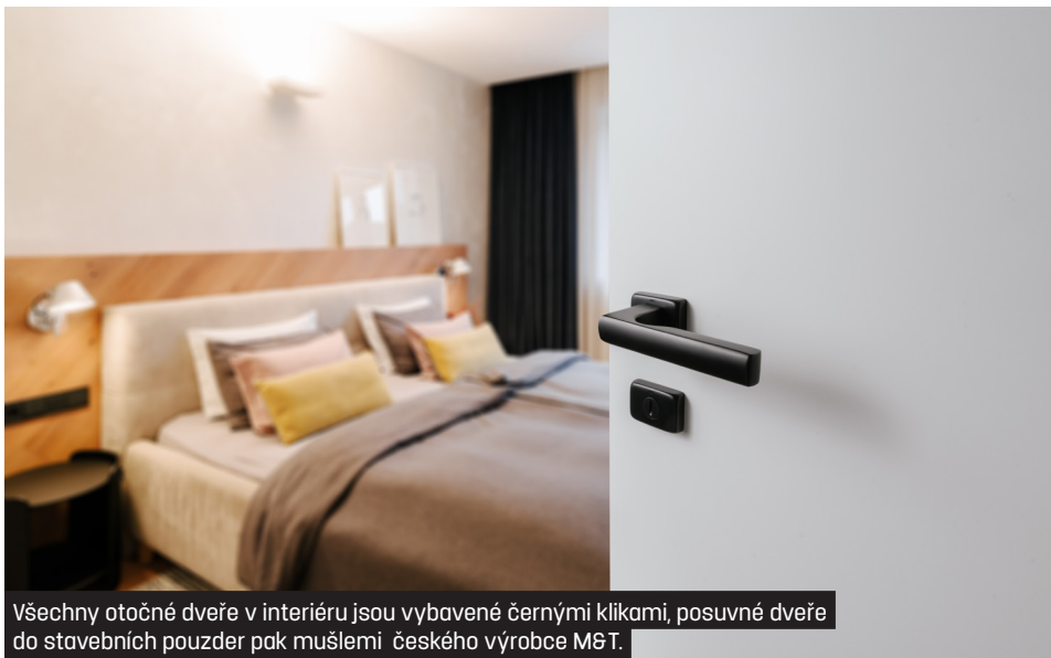
Všechny otočné dveře v interiéru jsou vybavené černými klikami, posuvné dveře do stavebních pouzder pak mušlemi českého výrobce M&T.