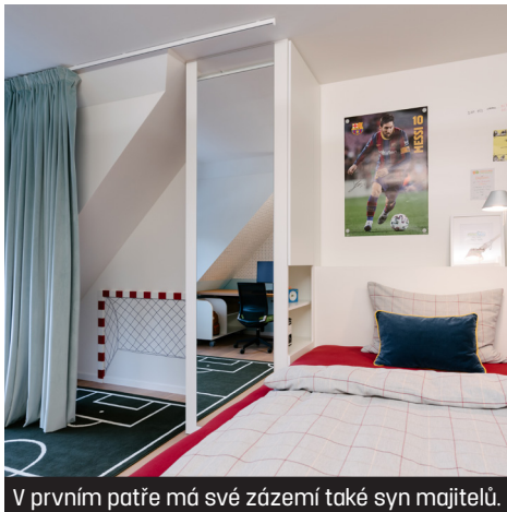
V prvním patře má své zázemí také syn majitelů.

Designérka Kamila Jarkovská vystudovala interiérový design na soukromé pražské škole. Její tvorba je ovlivněna především pobytem ve Švýcarsku a cestováním do zahraničí. Zabývá se návrhy interiérů bytů, kanceláří, reprezentativních prostor a hotelů.