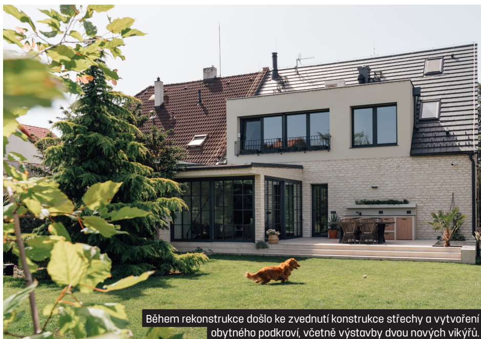
Během rekonstrukce došlo ke zvednutí konstrukce střechy a vytvoření obytného podkroví, včetně výstavby dvou nových vikýřů.

Přirozenost, lehkost a funkčnost. Tak by se dala popsat proměna rodinného domu na pražském Žižkově, který prošel radikální rekonstrukcí, zahrnující i novou zimní zahradu a obytné podkroví. Interiéru dodávají osobitost odvážně použité výrazné barvy.