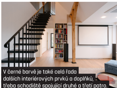
V černé barvě je také celá řada dalších interiérových prvků a doplňků, třeba schodiště spojující druhé a třetí patro.