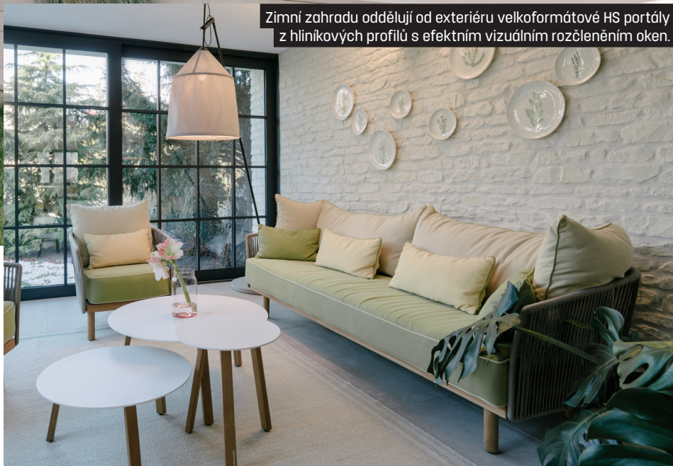
Zimní zahradu oddělují od exteriéru velkoformátové HS portály z hliníkových profilů s efektním vizuálním rozčleněním oken.