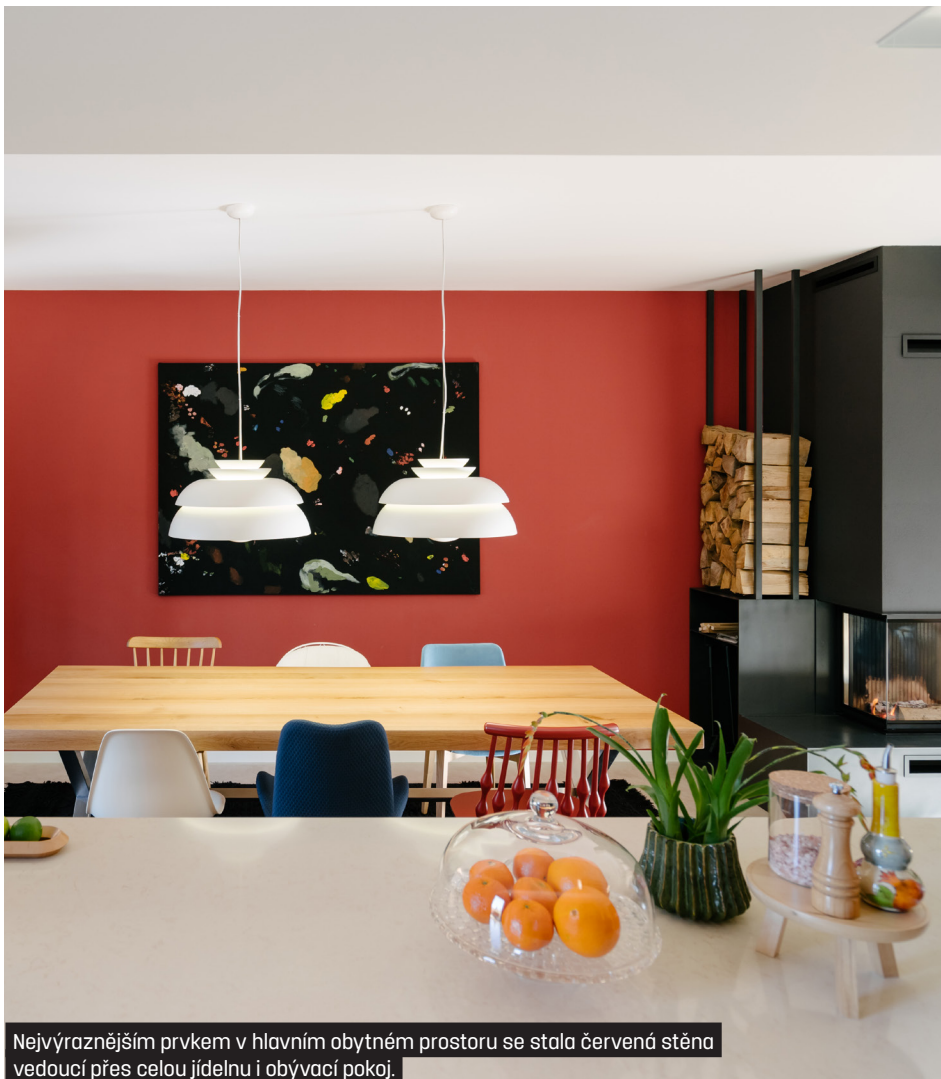
Nejvýraznějším prvkem v hlavním obytném prostoru se stala červená stěna vedoucí přes celou jídelnu i obývací pokoj.

V přízemí došlo ke stržení několika přiček kvůli jejich špatnému stavu a dělala se kompletně nová podlaha.