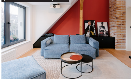
Červená barva se objevila také v otevřeném prostoru druhého patra.