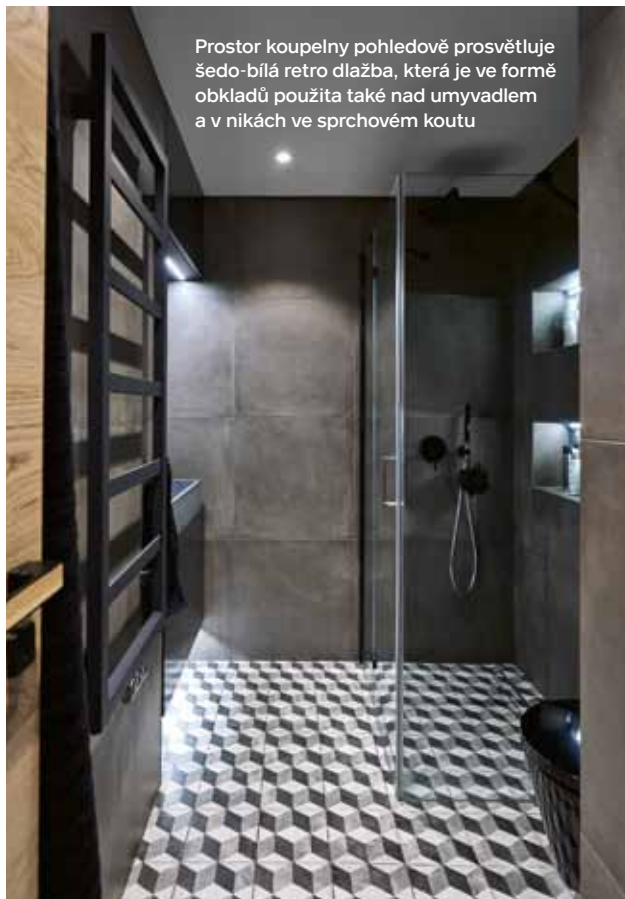
Prostor koupelny pohledově prosvětluje šedo-bílá retro dlažba, která je ve formě obkladů použita také nad umyvadlem a v nikách ve sprchovém koutu

Ostatní vybavení a doplňky interiéru reflektují základní podstatu jeho ladění. Dubovou dýhu tak kromě nábytkového vybavení nalezneme také na ploše interiérových dveří, a v kombinaci s černými liniemi dokonce i na dveřním kování. Pro dýhované dveře byly zvoleny kliky a mušle MAXIMAL od českého výrobce M&T. Matný černý vzhled klikám propůjčuje titanový povrch. Kromě klik od M&T se ale bytem prolínají i další české výrobky, jichž je architekt velkým fanouškem. Prvky v dubové dýze tak dále v interiéru podporují například dubové židle od firmy TON či masivní stůl z dílny výrobce Situs.