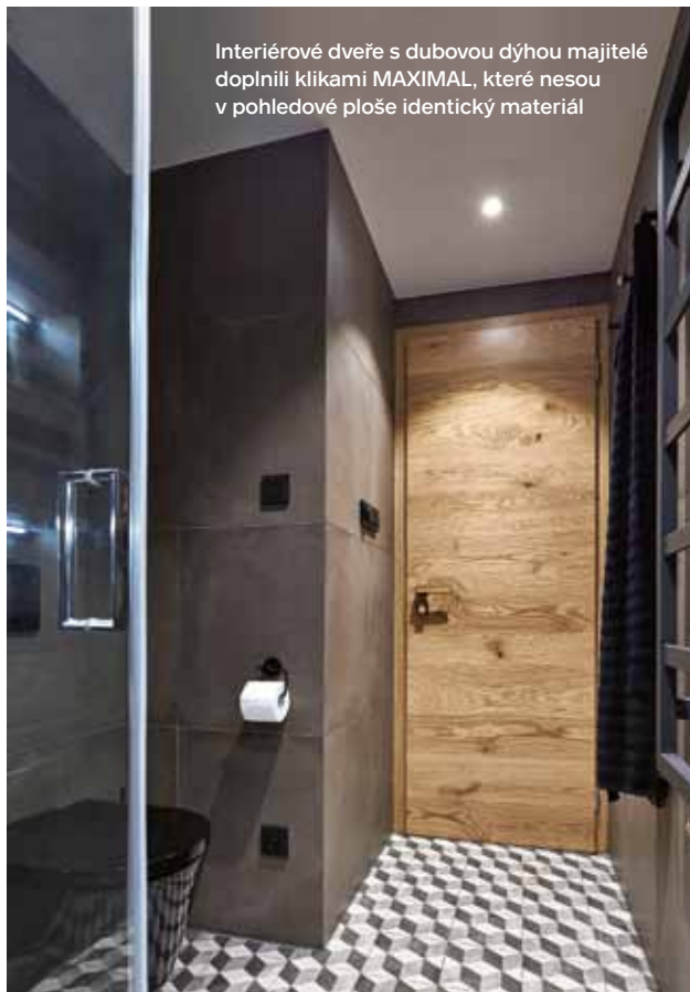
Interiérové dveře s dubovou dýhou majitelé doplnili klikami MAXIMAL, které nesou v pohledové ploše identický materiál